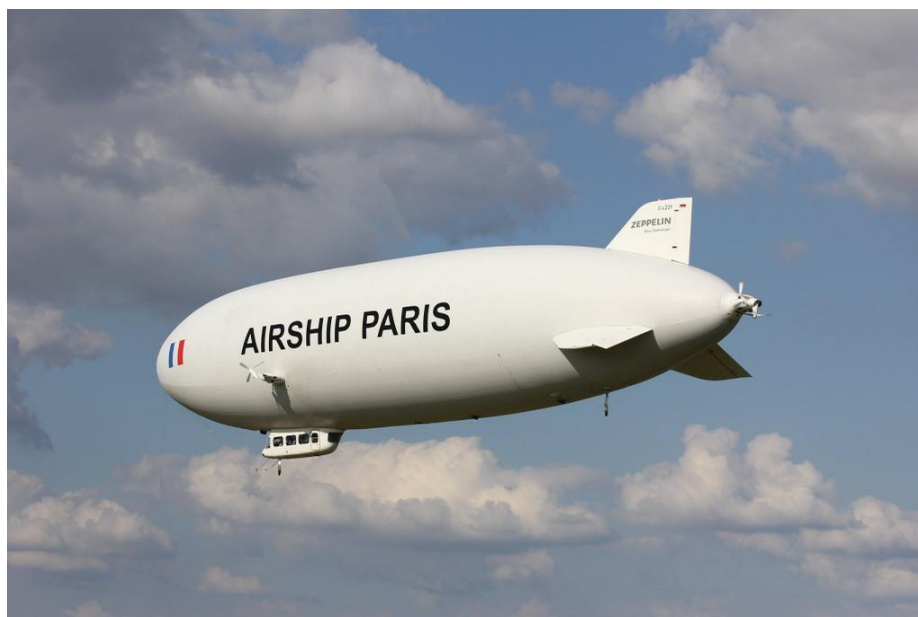
Vol touristique d'un Zeppelin, absent du ciel français depuis une centaine d'années.

« Et si les ballons dirigeables représentaient une alternative ?