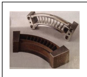
(Air & Cosmos)

Dans quel(s) matériau(x) peut-on actuellement obtenir une pièce par ce procédé ?